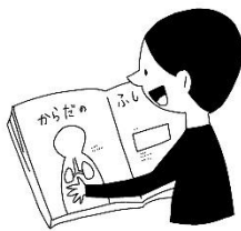
体のことについて、 知りたいことがある