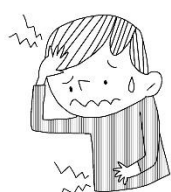
痛いところがある (頭やおなかなど)