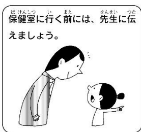
保健室に行く前には、先生に伝えましょう。