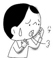
なやんでいることがある