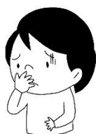
気分が悪くなった はきそう