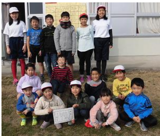
おはようさぎチーム