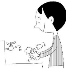
こまめに手を洗う