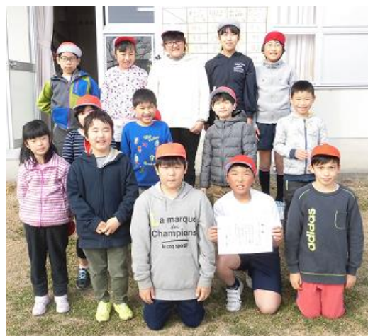
あいさつはりねずみチーム