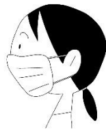
マスクを着用する