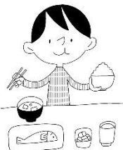
栄養バランスのよい食事