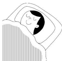
しっかりすいみんをとる